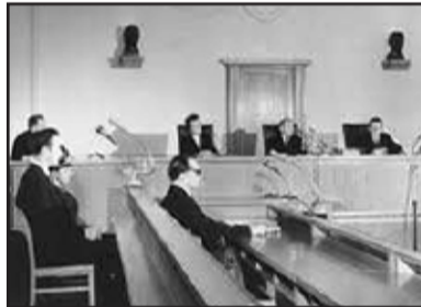
Gericht der DDR