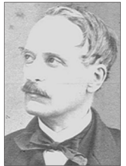
Luigi Federico Menabrea (1809-1896) Presidente del Consiglio (1867-1869) nominò in diverse circostanze Cantelli Ministro dei Lavori Pubblici, della P. Istruzione (ad interim) e dell'Interno

Nominato Senatore l'8 ottobre 1865, non abbandonò l'incarico di Prefetto di Firenze, che rappresentava una sorta di incarico di collegamento fra le politiche del territorio e i più vasti orizzonti della politica nazionale. Due anni dopo il Presidente del Consiglio Federico Menabrea, nell'esecutivo da lui formato il 27 ottobre 1867, gli affidò il dicastero dei Lavori Pubblici e, per qualche settimana, anche l'interim della Pubblica Istruzione (dal 27 ottobre al 18 novembre 1867). La durata estremamente